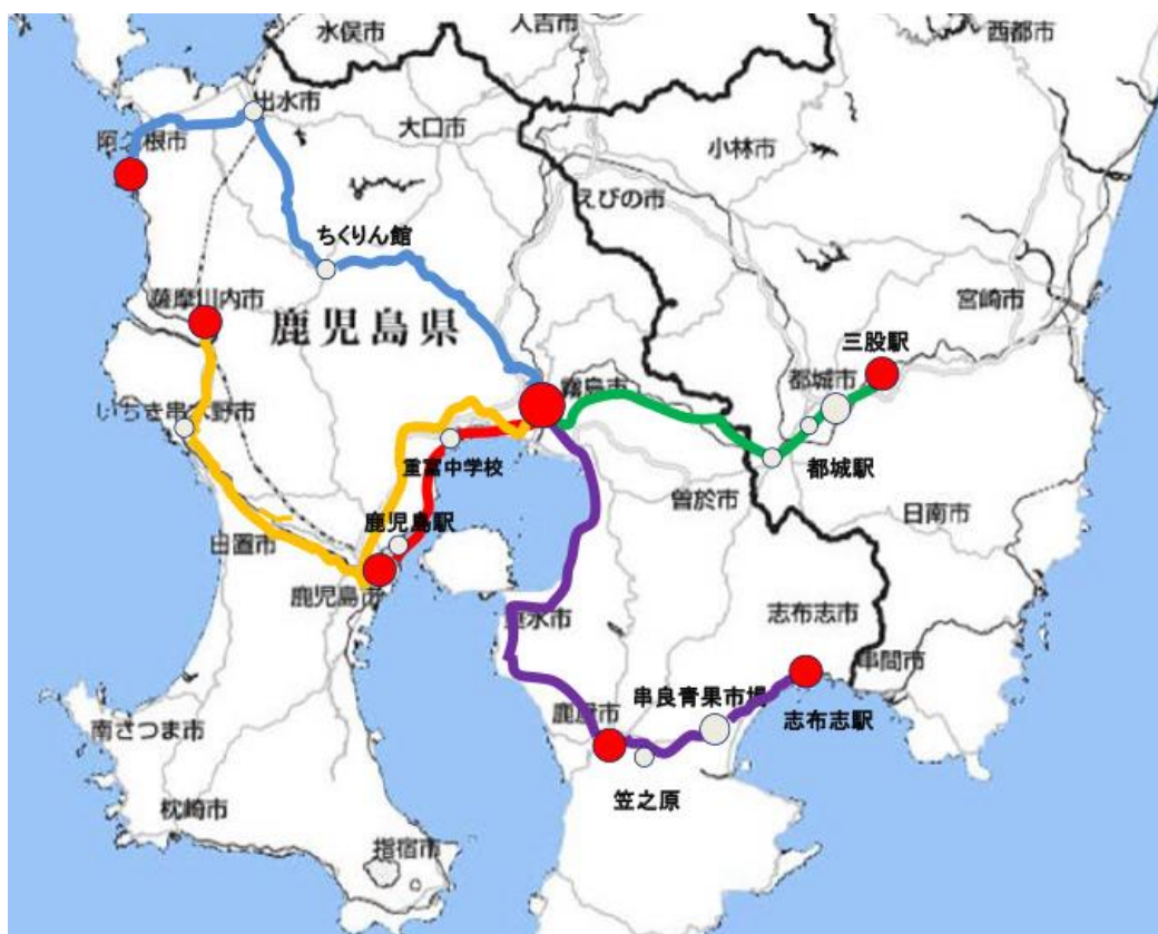
図 2 運行図