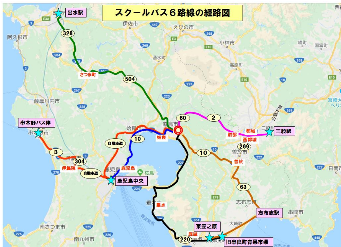
図 2 運行図